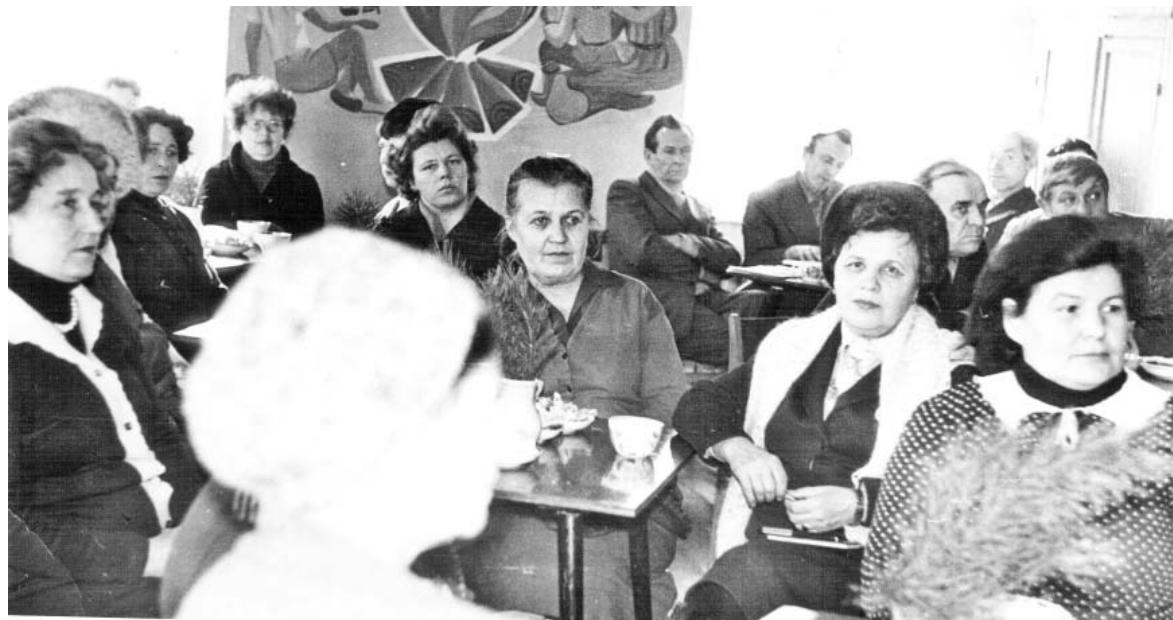
Огонёк с участием общественных корреспондентов, сентябрь 1984 года.